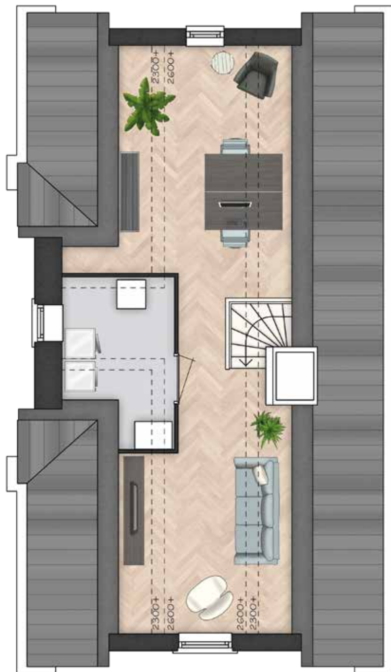
GETOOND BWR 102 TWEEDE VERDIEPING