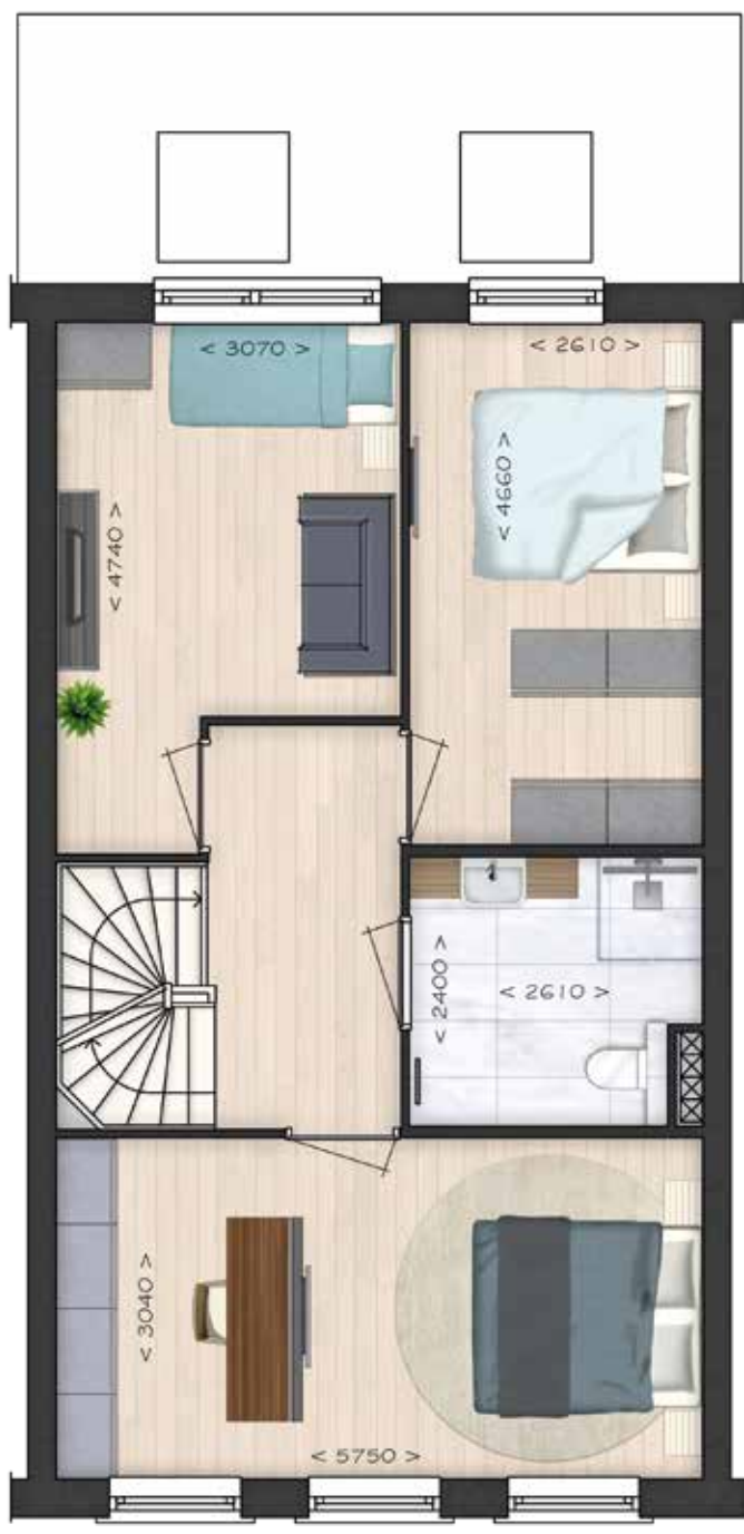
GETOOND BWR 64 EERSTE VERDIEPING