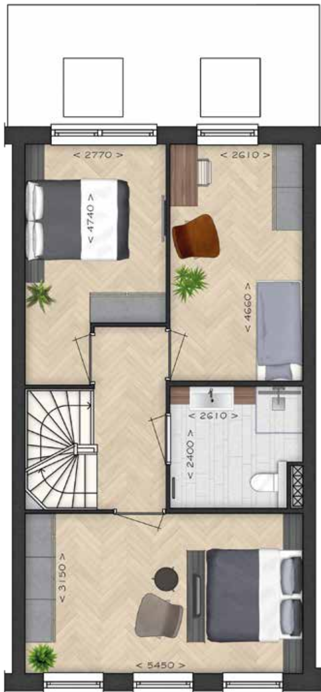
GETOOND BWR 88 EERSTE VERDIEPING