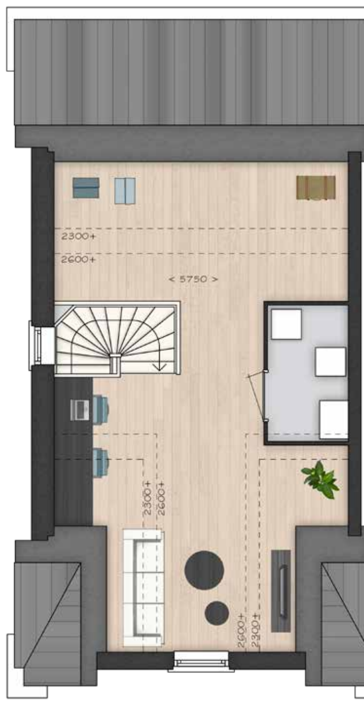
GETOOND BWR 101 TWEDE VERDIEPING