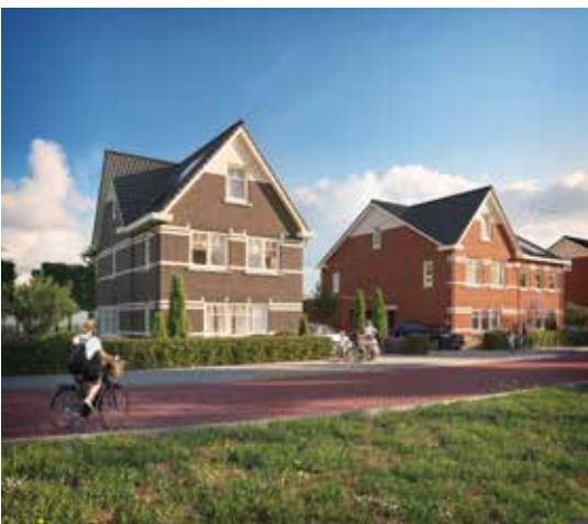
VRIJSTAANDE WONINGEN VILTROOS

WELK WONINGTYPE U OOK KIEST AAN DE LAAN, ALLE RUIJTE OM UW WOONWENSEN UIT TE LATEN KOMEN!