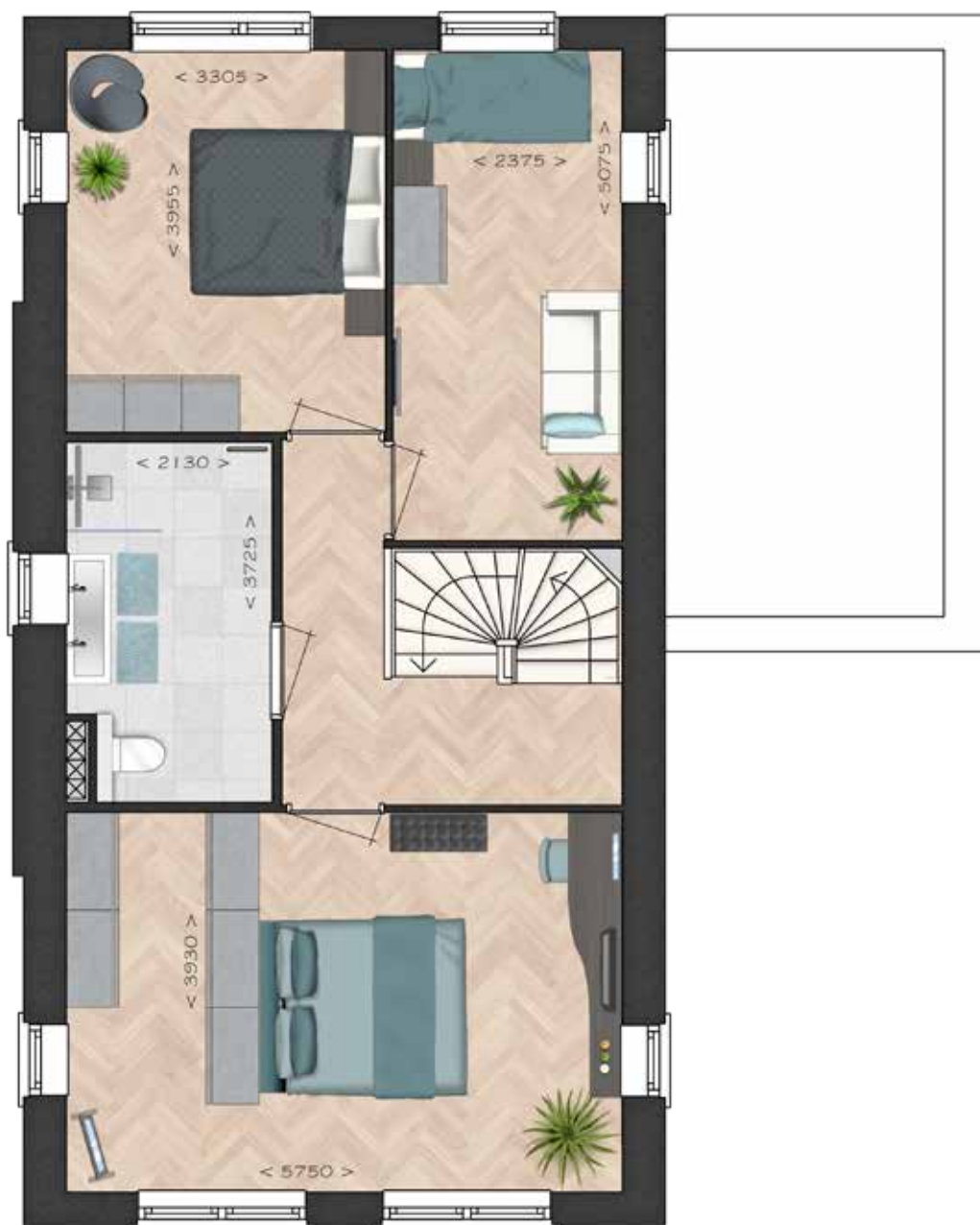
GETOOND BWR 102 EERSTE VERDIEPING