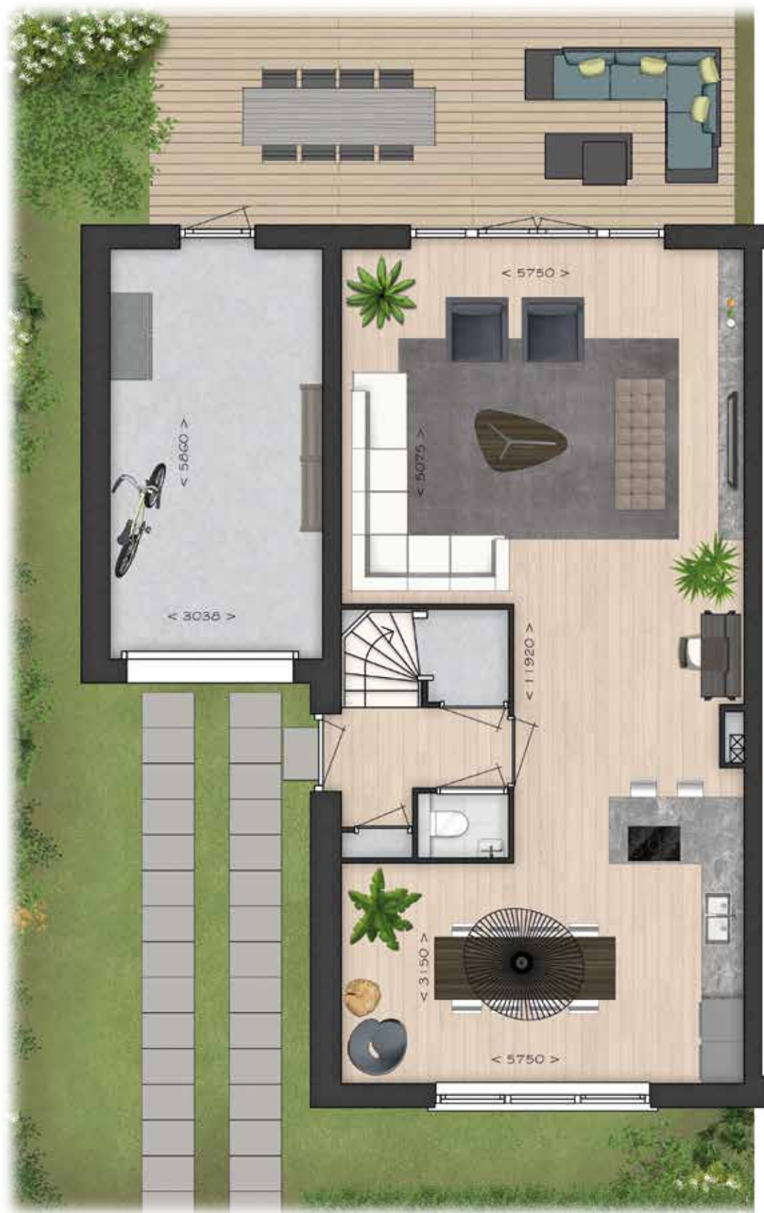
GETOOND BWR 101 BEGANE GROND