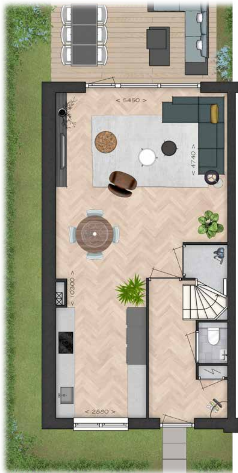
GETOOND BWNR 90 BEGANE GROND