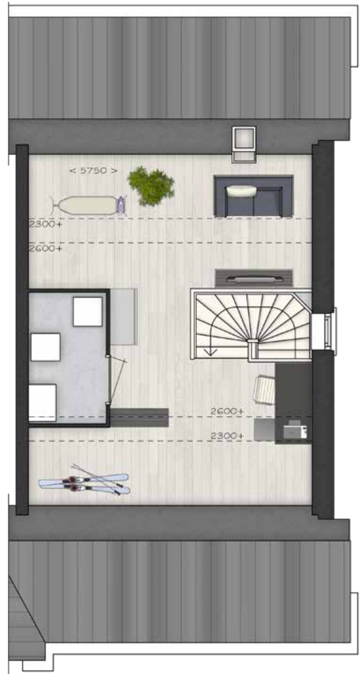
GETOOND BWR 100 TWEDE VERDIEPING