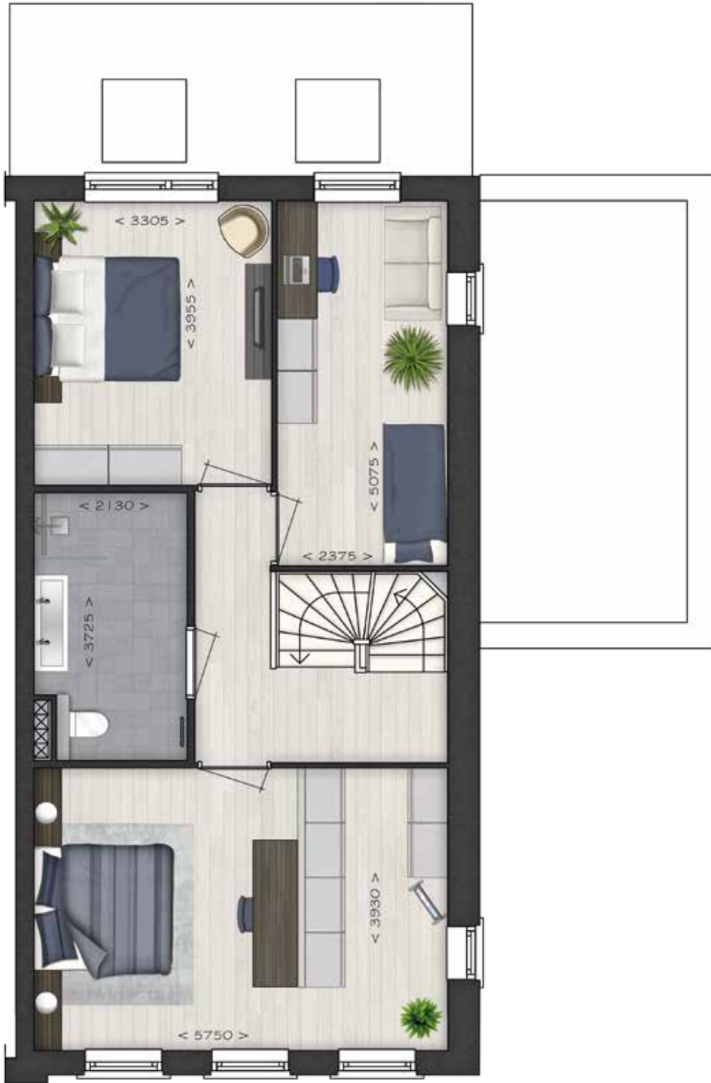
GETOOND BWR 100 EERSTE VERDIEPING