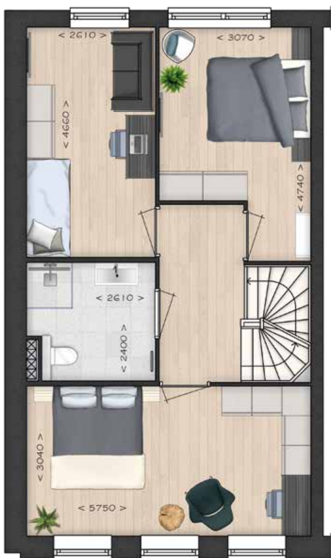
GETOOND BWR 58 EERSTE VERDIEPING