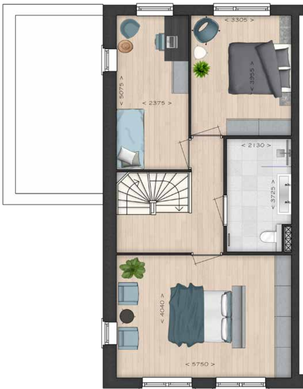
GETOOND BWR 101 EERSTE VERDIEPING