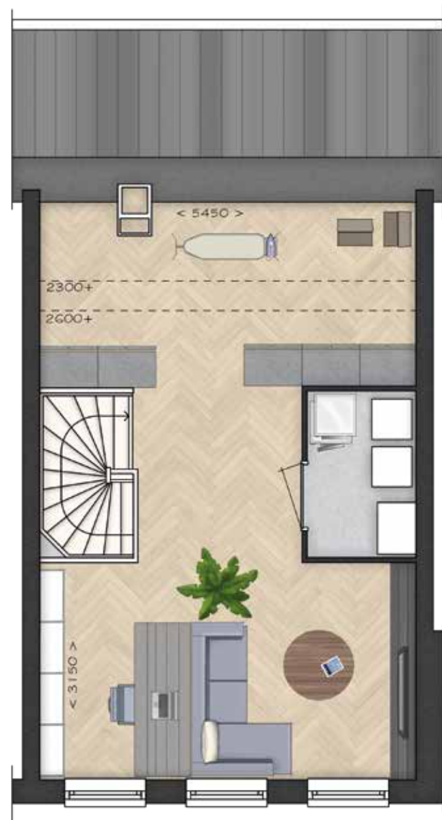
GETOOND BWR 88 TWEDE VERDIEPING