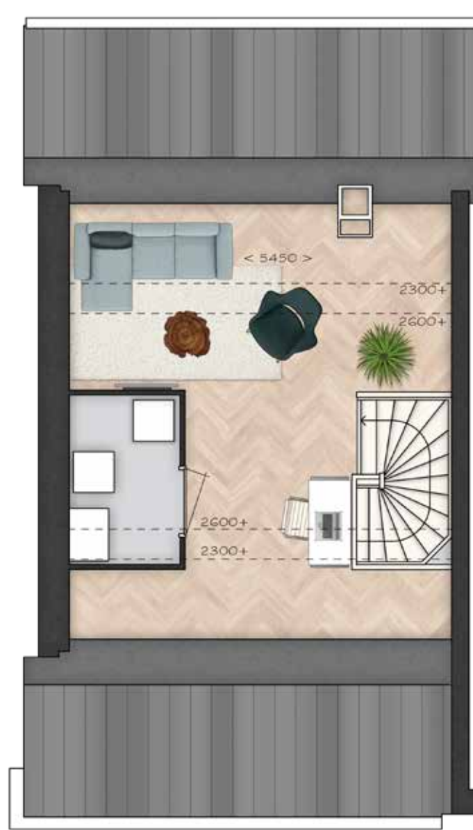
GETOOND BWR 90 EERSTE VERDIEPING