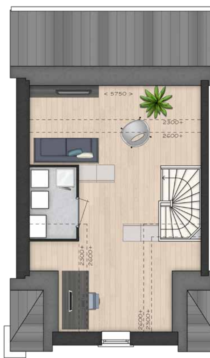
GETOOND BWR 58 TWEDE VERDIEPING