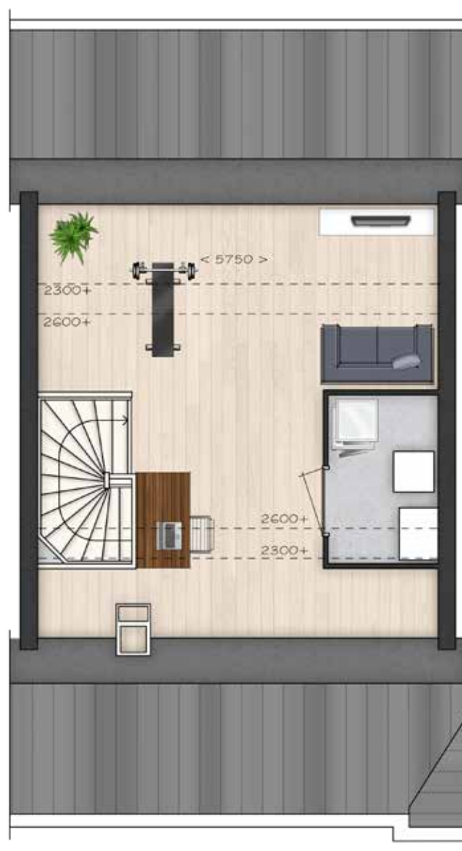
GETOOND BWR 64 TWEDE VERDIEPING